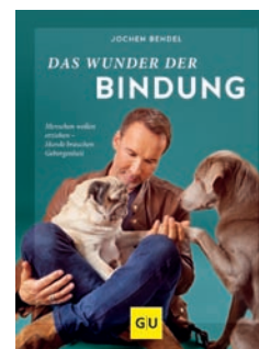
Das Wunder der Bindung Jochen Bendel

Sowohl einfühlsam als auch unterhaltsam schreibt der Autor, TV-Moderator und Hundetrainer Jochen Bendel über die Erfahrungen mit seinem Hunde-Duo Gizmo und Khaleesi und über den Hunde-Schul-Alltag. Jochen Bendel nimmt den Leser mit auf eine sehr persönliche, lustige und erfrischend selbstkritische Reise. Es sind inspirierende Bindungsgeschichten, die zum Schmunzeln und Nachdenken anregen.