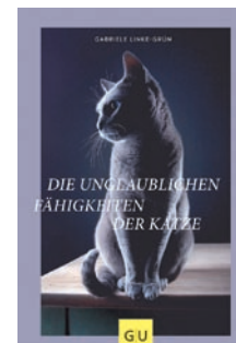
Die unglaublichen Fähigkeiten der Katze Gabriele Linke-Grün

Experten analysieren die einzelnen Geschichten und erklären das Verhalten auf Basis neuer Forschungsergebnisse. Dabei geht es nicht darum, der Katze die Mystik zu nehmen, sondern mit vielen Vorurteilen aufzuräumen und durch Erkenntnisse, zum Beispiel, bei der Krankheitserkennung, Katzen-Verhalten besser zu deuten. Zwischendurch trifft der Leser auf wunderbare lyrische Zitate. In dem Hardcover-Buch findet der Leser aber auch einen Mythen-Check, in dem „Volksmeinungen“ gegenüber Katzen unter die Lupe genommen und daraus Schlüsse fürs Zusammenleben gezogen werden. Zusätzlich gibt es Informationen rund um das Wesen und die Fähigkeit der Miezchen.